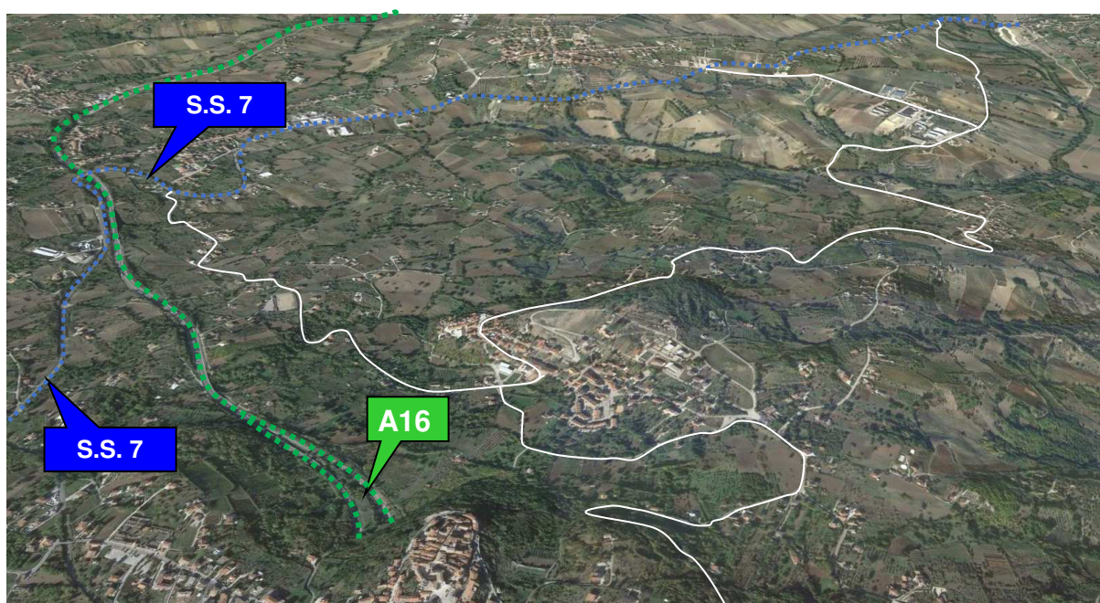
Figura 1 – I principali assi viari

Nella parte nord-ovest del territorio comunale, oltre alla A16, scorre la Strada Statale 7 costituente il principale collegamento tra i paesi del comprensorio ed il capoluogo di provincia.